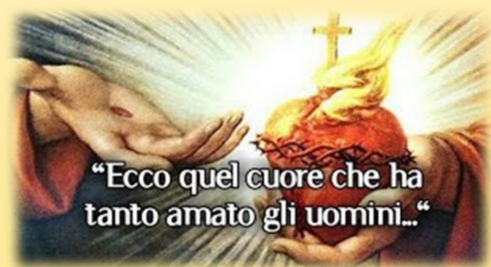
“Ecco quel cuore che ha tanto amato gli uomini...”

Il cuore di Gesù é per noi fonte di vita, perché dal suo cuore aperto sgorga Sangue e Acqua, fonte di salvezza e perdono dei peccati. Il cuore di Gesù é per noi rifugio e forza, se riconosciamo questo saremo felici. Tante volte andiamo da tutte le parti cercando sollievo dalle nostre sofferenze e dimentichiamo di andare da Colui che ci dona la vita.