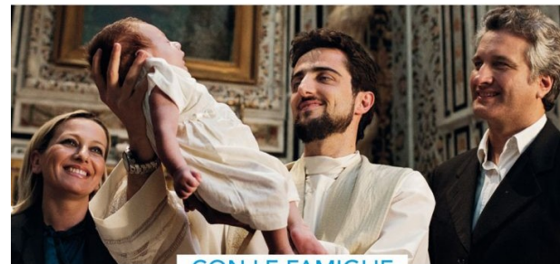
CON LE FAMIGLIE